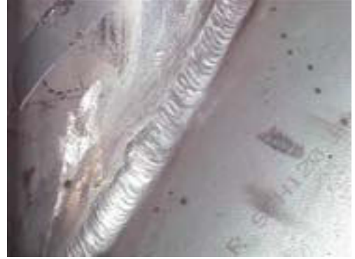
Détail de la zone soudée après traitement chimique de surface : le but de ce traitement n'est pas de supprimer le joint de soudure lui-même, mais la coloration qui l'accompagne.

Les traces colorées dues au soudage apparaissent souvent sur les zones thermiquement affectées de produits soudés en acier inoxydable même lorsqu'une méthode correcte au gaz protecteur est utilisée ( d'autres