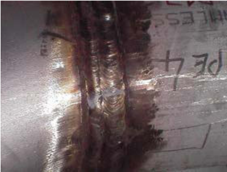
La pièce en acier soudée lors du soudage : la couche d'oxyde peut favoriser la corrosion si elle n'est pas supprimée correctement.

paramètres de soudage, comme la vitesse de soudage, peuvent influencer sur la nuance des traces colorées qui apparaissent autour du cordon de soudure).