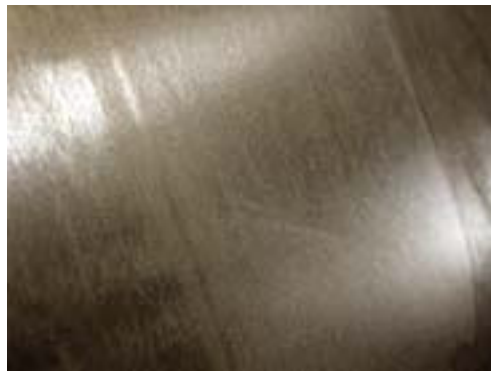
Les surfaces en acier inoxydable forment une couche gris/noir pendant le laminage ou le formage à chaud. Cette couche d'oxyde tenace est enlevée dans l'aciérie par décalaminage.

Le décapage consiste à enlever une fine couche de « métal » de la surface de l'acier inoxydable. Des mélanges d'acide nitrique et fluorhydrique sont généralement utilisés pour décaper l'acier inoxydable. Le décapage est le procédé utilisé pour enlever les couches colorées par soudage de la surface des produits en acier inoxydable, où le niveau de chrome de la surface en acier a été réduit.