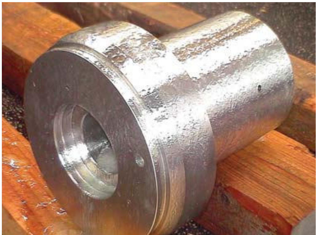
Les petites pièces en acier inoxydable peuvent être efficacement décapées avec du gel appliqué à la brosse.

L'association de développement de l'acier inoxydable la plus proche de chez vous peut vous conseiller sur les fournisseurs locaux de produits et de services de décapage.