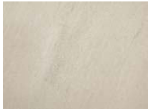
Un gris mat reste sur les produits recuits après le décalaminage et le décapage. Le brisement de la couche d'oxyde rend la surface rugueuse.