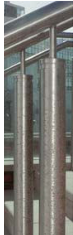
La rouille par contamination au fer pendant la durée de vie de l'acier inoxydable est laide. Sa suppression peut être longue et chère.

L'association de développement de l'acier inoxydable la plus proche de chez vous peut vous conseiller sur les sociétés spécialisées dans la décontamination du fer et la restauration générale et le nettoyage des éléments architecturaux.