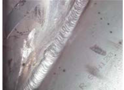
Mechanische Oberflächenbehandlung einer Schweißverbindung: Ihr Ziel liegt nicht in der Einebnung der Schweißnaht, sondern der Entfernung von Anlauffarben in ihrer Umgebung.

Anlauffarben treten insbesondere in der Wärmeeinflusszone von Schweißnähten auf, auch bei sachgerechter Schutzgasanwendung. Andere Schweißparameter wie die Vorschubgeschwindigkeit können ebenfalls die Bildung von Anlauffarben im Bereich der Schweißraupe beeinflussen.