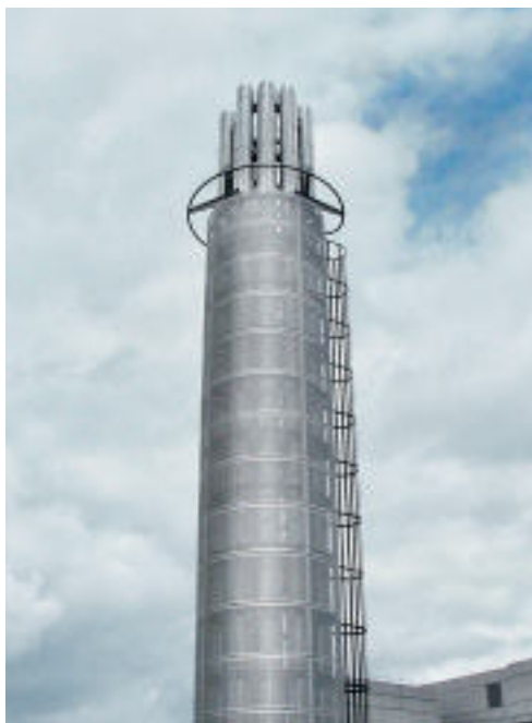
Die sieben Edelstahlschornsteine der Energiezentrale im BBC Medienpark White City in London sind an einer freistehenden Tragmastkonstruktion befestigt und mit Streckmetall verkleidet.

Die zentrale Gasheizung dieser Wohnanlage in Kaiserslautern führt das Abgas über einen außenliegenden Edelstahlkamin ab. Zudem besitzen alle Häuser Kaminöfen, die jeweils an einen Edelstahlschornstein angeschlossen sind.